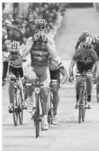
Lo sprint del gruppo sul traguardo di Bonorva